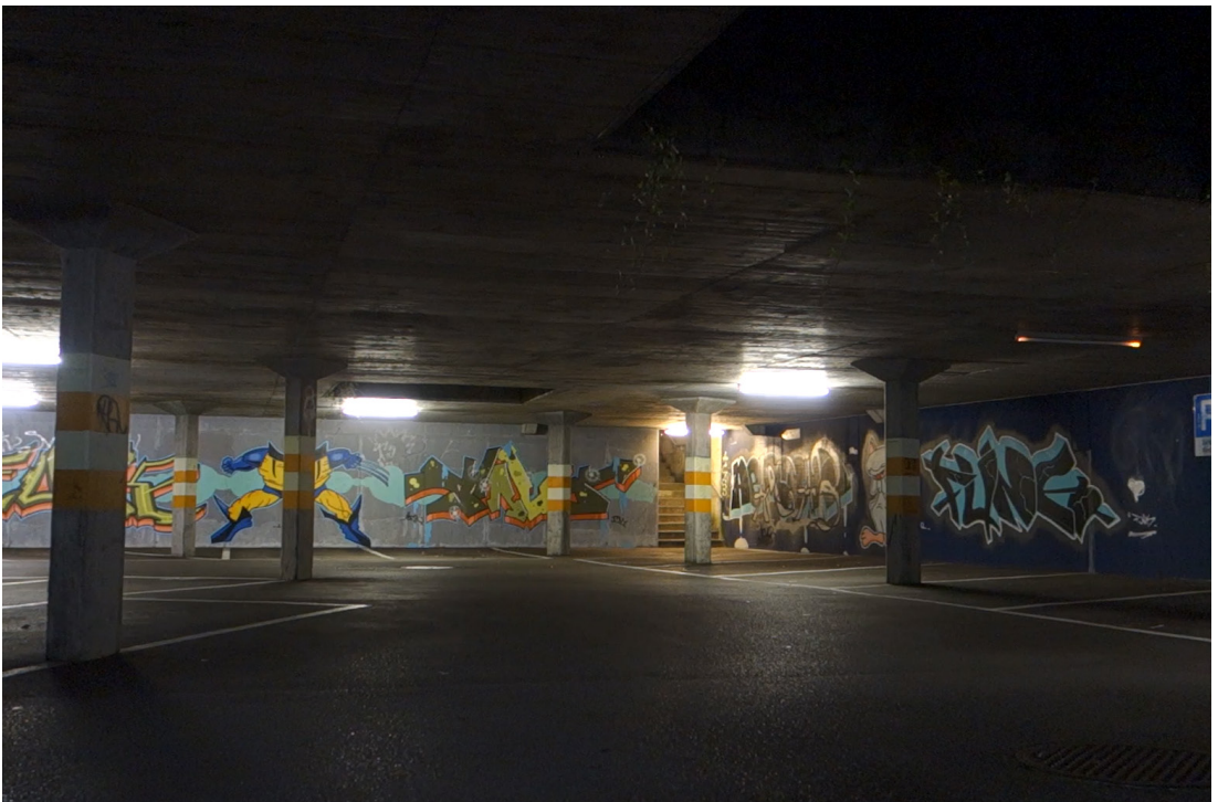
[Videoversuch, Unbearbeitet, 31 Sek.]