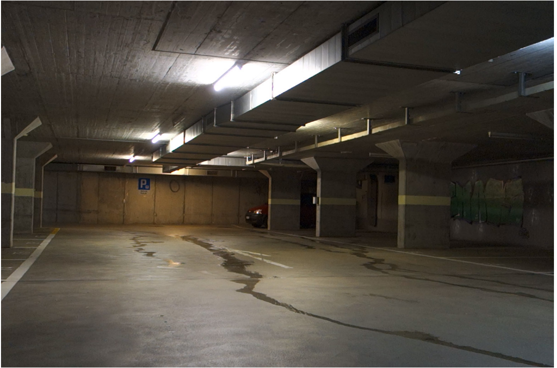
[Videoversuch, Unbearbeitet, 32 Sek.]